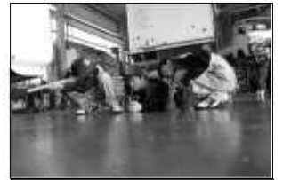
タイヤ交換の実習中 ジャッキアップポイントは、 どこかな？みんなで確認中！