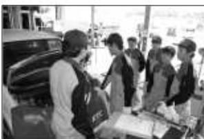
法定12ヶ月点検の実習中 中学生4人とアルバイトの 学生君。講師は息子でした。

今年の夏は、うれしい事に職場 体験に4人の中学生が来てくれま した。今回はメカニックスーツと 帽子、安全靴も用意して中学生を 迎えました。