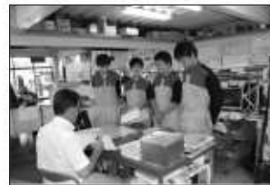
日誌を、社長に見てもらって います。緊張してる？