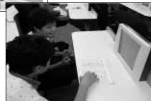
オークション 会場では、実際 の画面を見てい ます。楽しそう ですわね。

社外施設見学 広島県自動車整備振興会福山支所 (写真 左) 広島市のオークション会場(写真 下) 職場体験期間中に、2箇所を見学しま した。