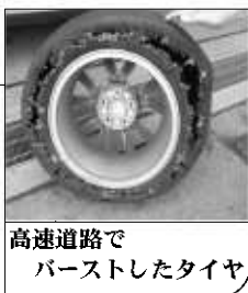
高速道路でバーストしたタイヤ

パンパンに膨らんだ風船と同じですね。ちょっとした事でパンクしてしまいます。最悪、バースト（破裂）なんて事もあります。