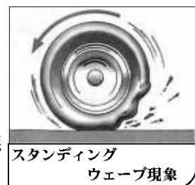
スタンディングウェーブ現象