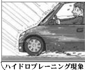
ハイドロプレーニング現象